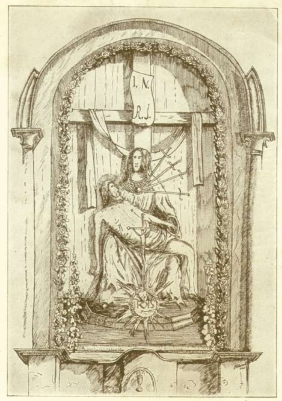
Das Gnadenbild «Maria sieben Schmerzen» zu Oberskrill - Gottschee.

Ekspoziturna cerkev Žalostne Matere božje (odstranjena) / Župnija Mozelj (Kočevska Reka)