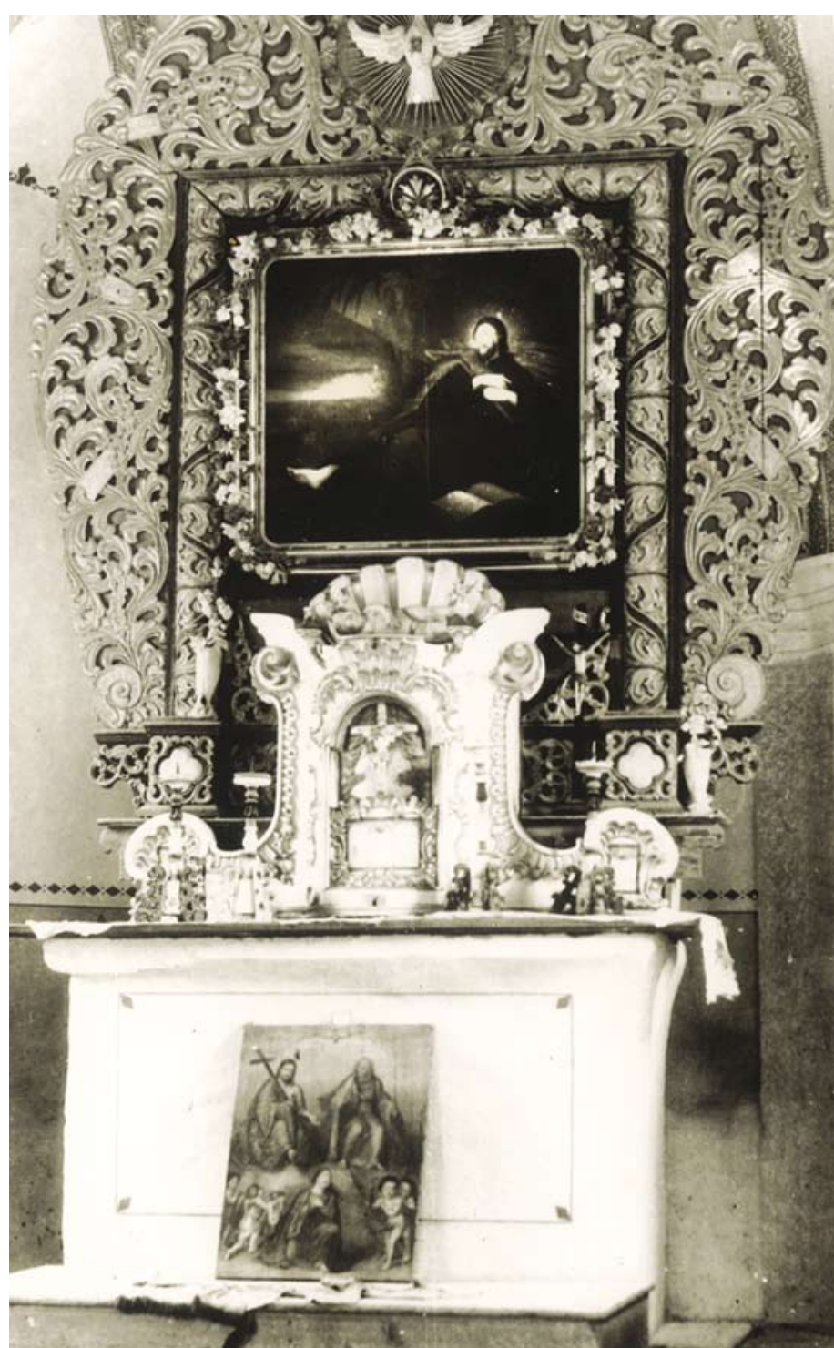
foto / Foto Marijan Zadnikar, 1947, Ministrstvo za kulturo – INDOK center

Henrika Langus, St. Franz Xaver, 1855 (?)